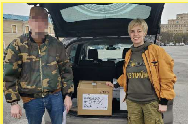
Подяки від бригад на передовій фронті за передані розвідувальні безпілотики