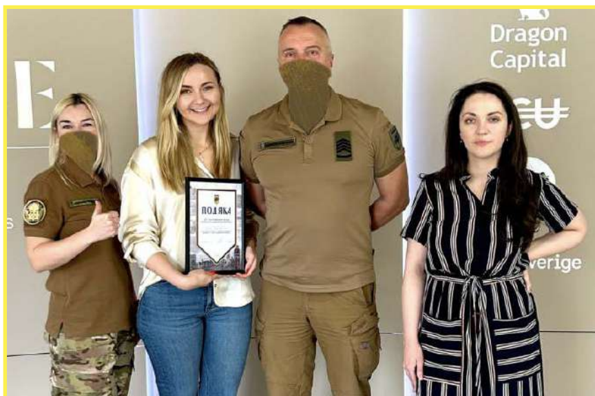
Подяка від бійців і командування бригади Національної гвардії України "Азов"